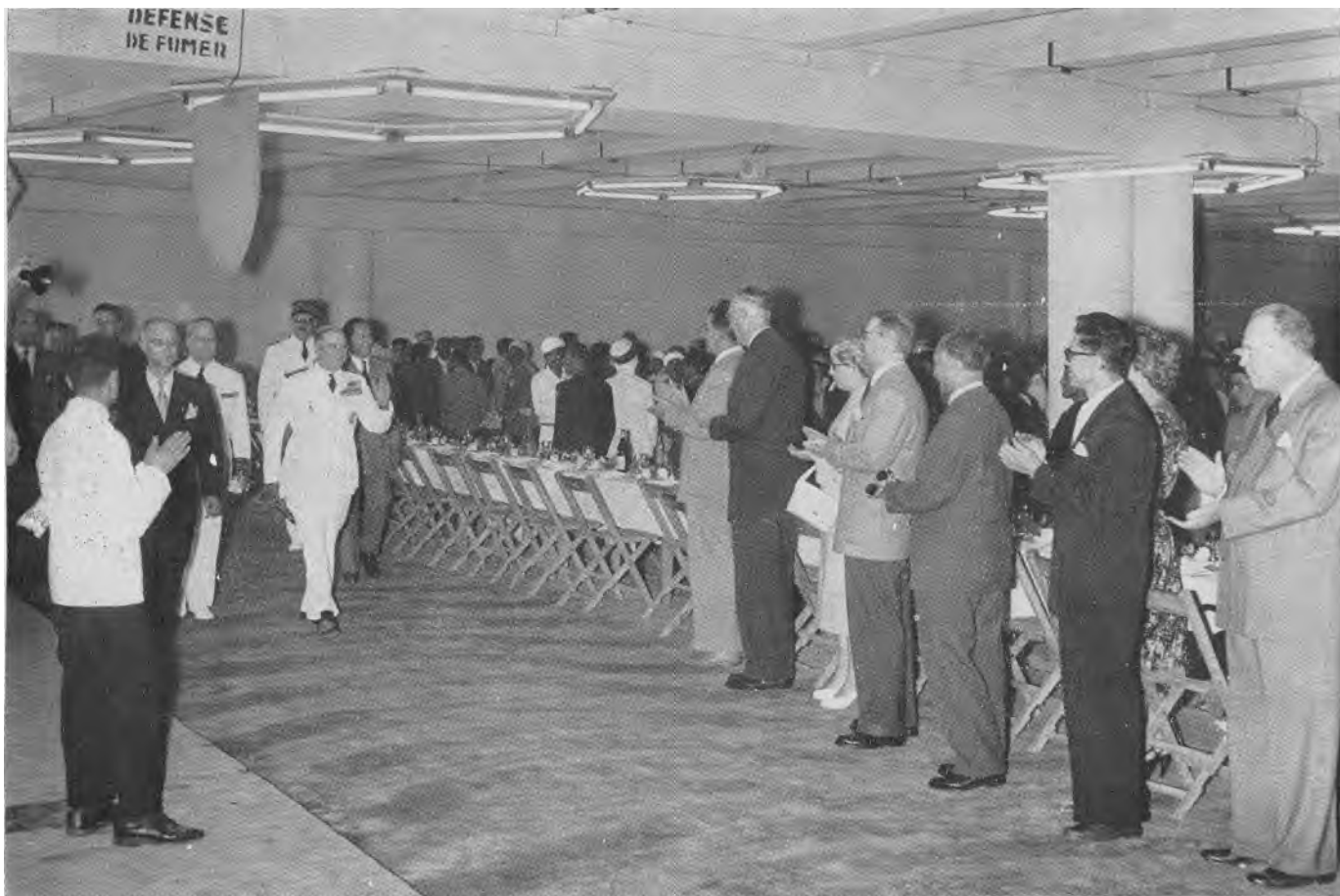
e Le maréchal Juin, accueilli par des applaudissements, arrive dans le hall de la gare maritime.