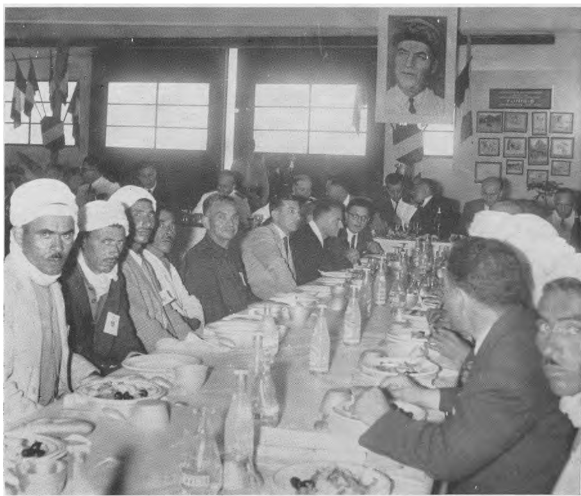
• Une table, du couscous monstre de près de 2.000 couverts. Les convives sont fraternellement mélangés.