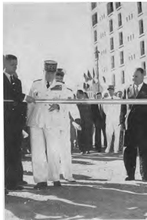
Le maréchal a examiné en détail les réalisations de la nouvelle cité. Il en exprime au député-maire, visiblement touché, sa surprise admirative.